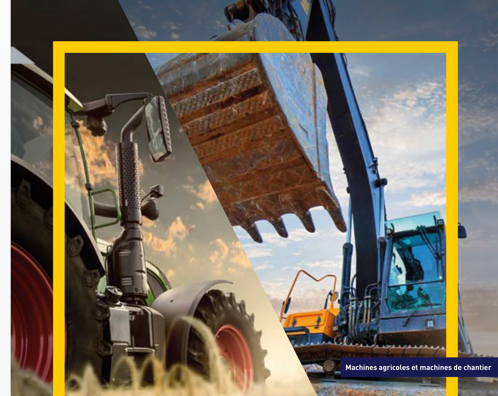
Machines agricoles et machines de chantier